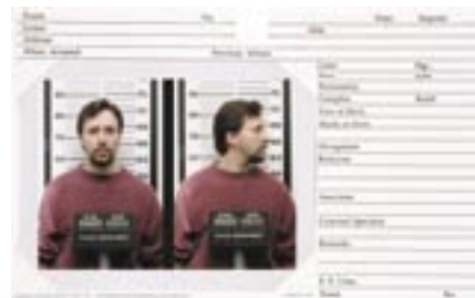
TABELA PARA IDENTIFICAÇÃO DE ALTURA

Usa a tabela para identificação de altura com qualquer sistema de identificação fotográfica. Ela é impressa em preto sobre um fundo branco com graduações métrica e medida Inglesa. A tabela está disponível previamente montada sobre um resistente apoio de 32" x 21" x 0,125" (80 cm x 52,5 cm x 0,31 g) ou desmontada.